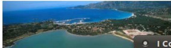
Villasimius, stagno di Notteri

Farmacie e ospedali Strutture sanitarie Strutture sociali Strutture per l'infanzia Servizi sociali Centri di accesso Internet