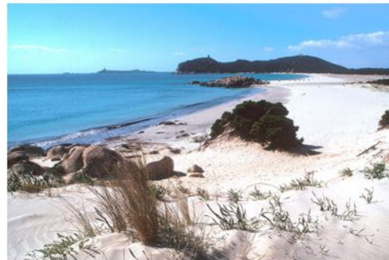
Villasimius, spiaggia del Timiama